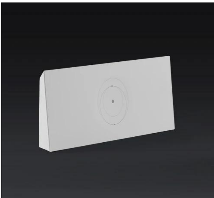
ROUTER GEN 3