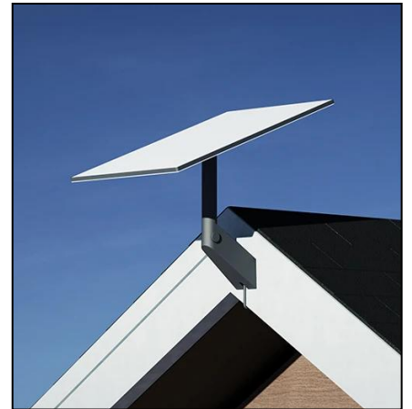
SOPORTE DE PARED